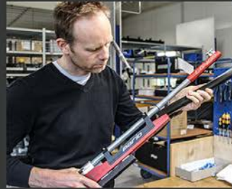
Christian Planer Rifle Fitting/Service, Reparaturen